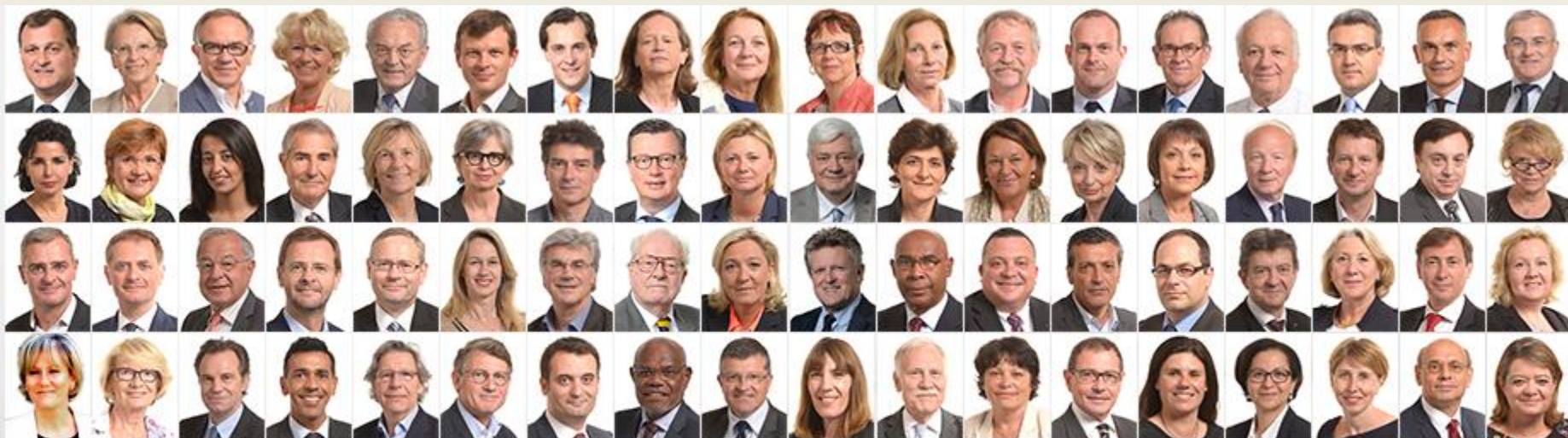
Les 74 députés européens élus en France