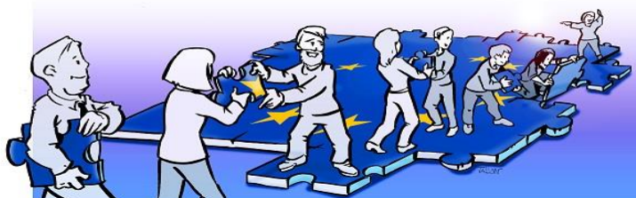
Illustration: Studio TALLON