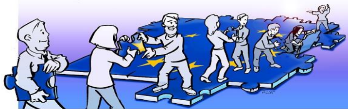
Illustration: Studio TALLON