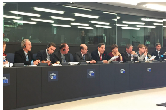
AEDE Congress in Strasbourg (January 11, 2018)